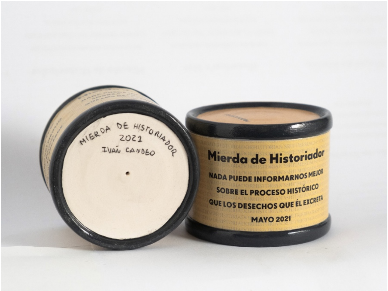
“Mierda de historiador” (homenaje a Piero Manzoni), 2021